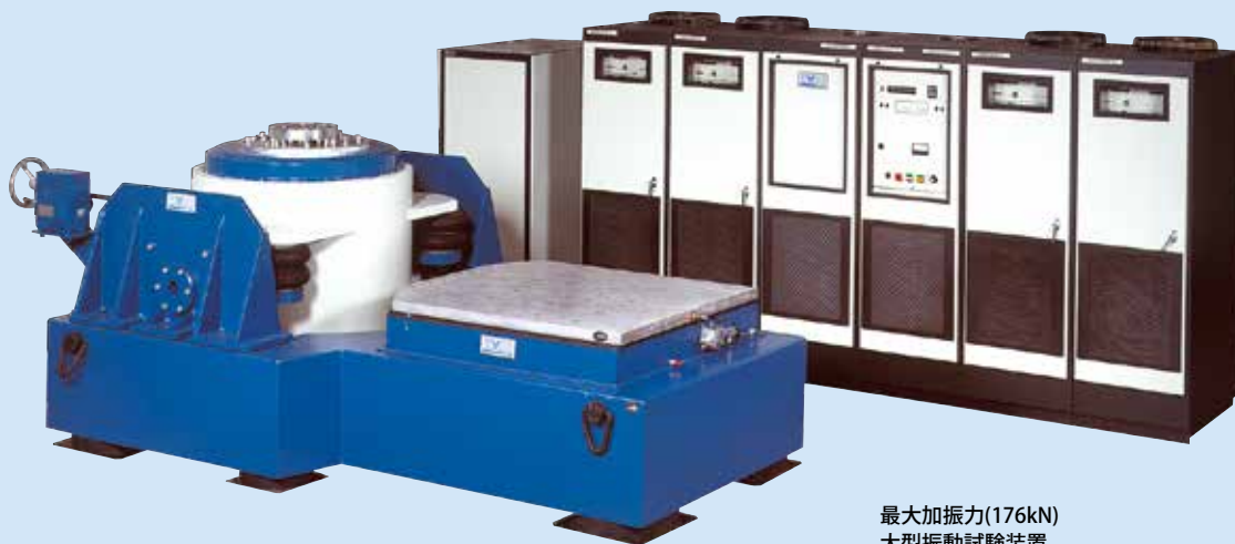
最大加振力(176kN) 大型振動試験装置

エミックの受託試験サービスは、「環境試験、品質試験、信頼性試験のアウトソーシング」です。試験対象をお持ち込み頂き、品質試験、耐久試験などの環境試験を、弊社受託試験センターに設置されている試験装置で行うことができます。既存の設備を利用頂けるので、必要な時に必要な試験を実施できます。試験設備は水平加振台や大型振動試験装置など、豊富な試験装置を用意していますので、要求される試験条件や試験装置の仕様に左右されることが少なく、多様な試験でも柔軟に対応できます。また試験装置のご利用だけでなく、環境試験のソリューションも提供しています。