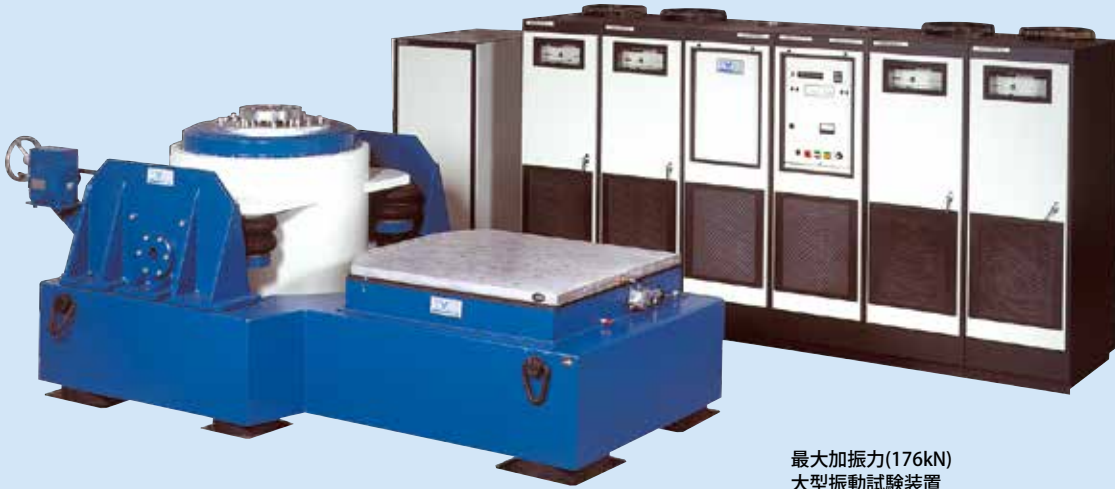
最大加振力(176kN) 大型振動試験装置

エミックの受託試験サービスは、「環境試験、品質試験、信頼性試験のアウトソーシング」です。試験対象をお持ち込み頂き、品質試験、耐久試験などの環境試験を、弊社受託試験センターに設置されている試験装置で行うことができます。既存の設備を利用頂けるので、必要な時に必要な試験を実施できます。試験設備は水平加振台や大型振動試験装置など、豊富な試験装置を用意していますので、要求される試験条件や試験装置の仕様に左右されることが少なく、多様な試験でも柔軟に対応できます。また試験装置のご利用だけでなく、環境試験のソリューションも提供しています。